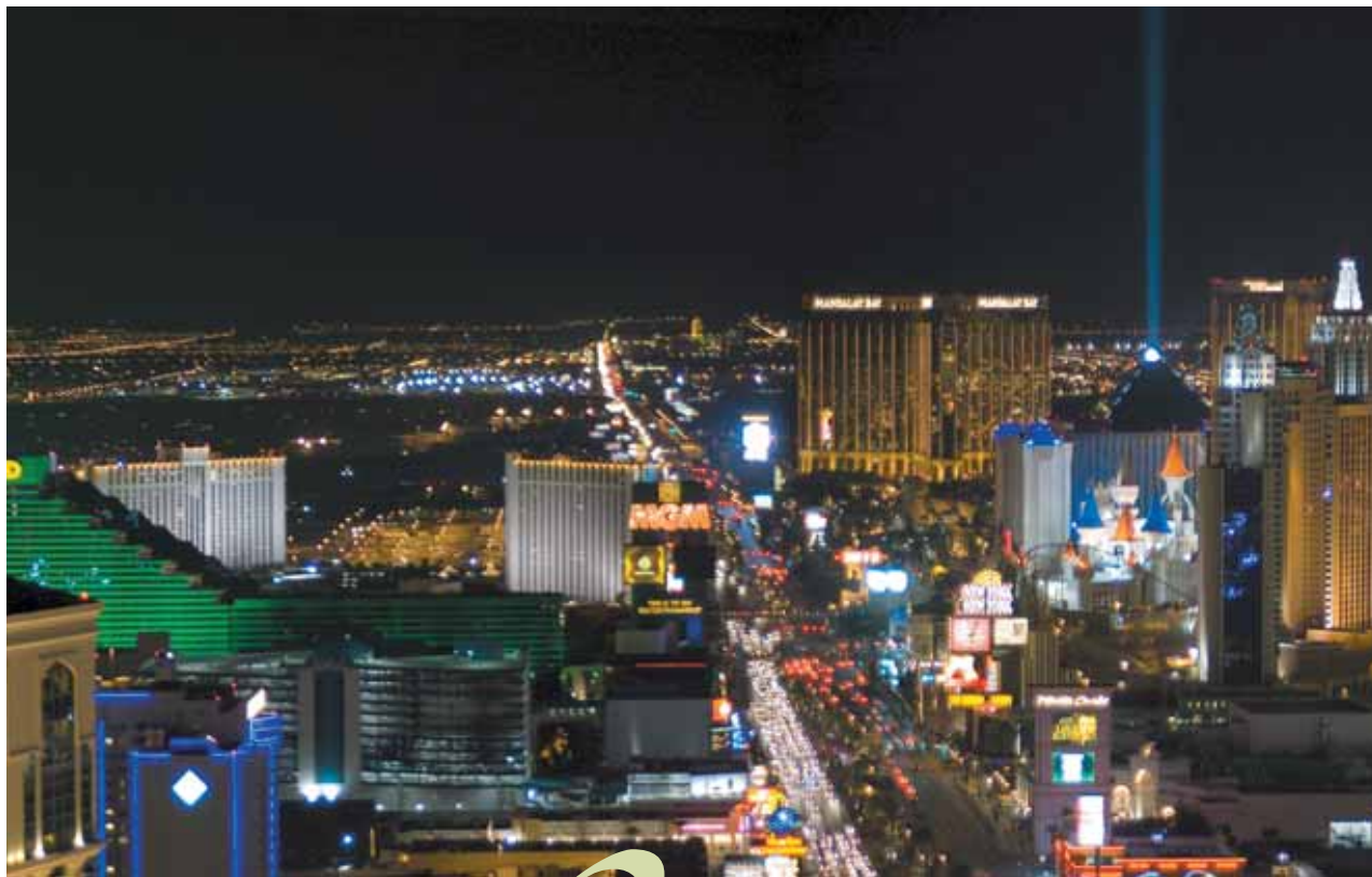
Las Vegas Strip