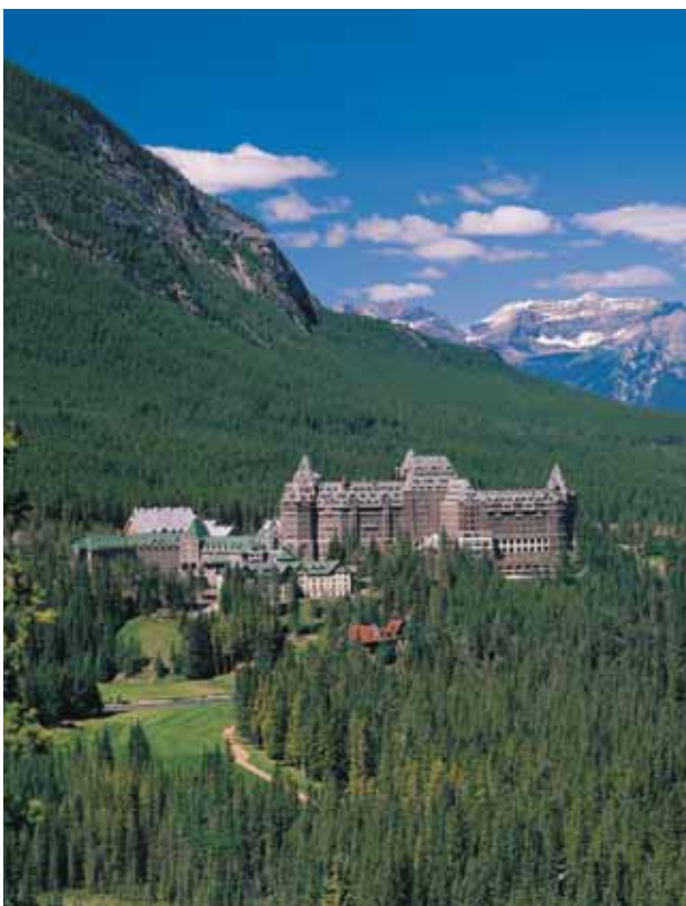
Banff: Fairmont Banff Springs

Día 1. España ▶ Vancouver . Salida en vuelo de línea regular con destino a Vancouver. Recepción en el aeropuerto y traslado al hotel. Alojamiento.