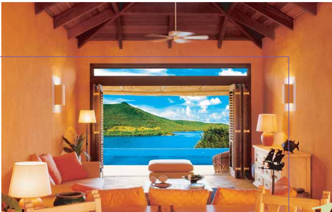
Raffles Resort Canouan Island • Personality Suite