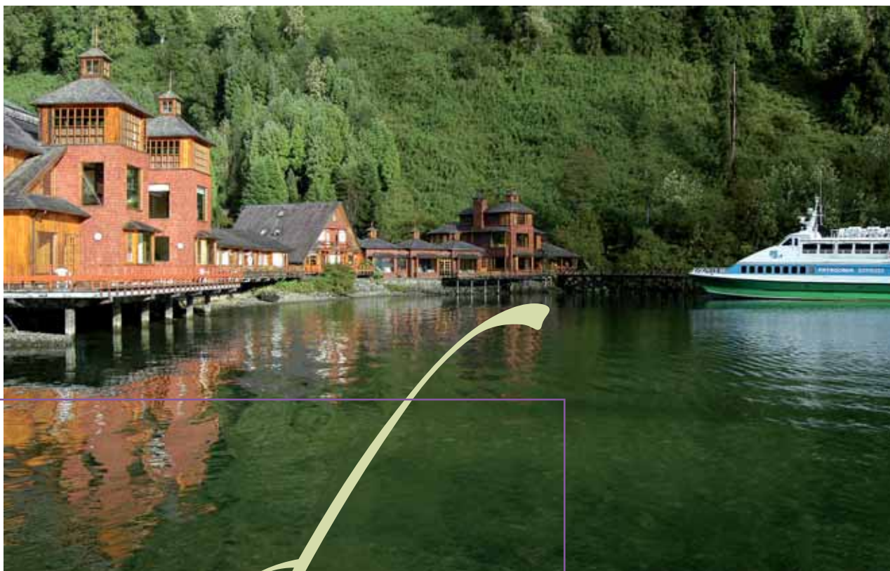
Puyuhuapi Lodge & Spa y Catamarán