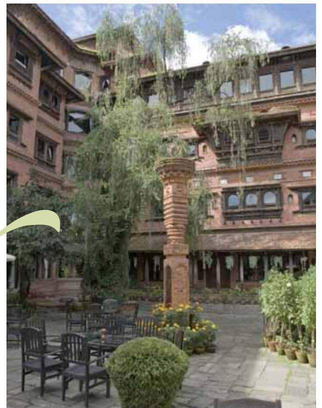
Kathmandú: Dwarika's Hotel