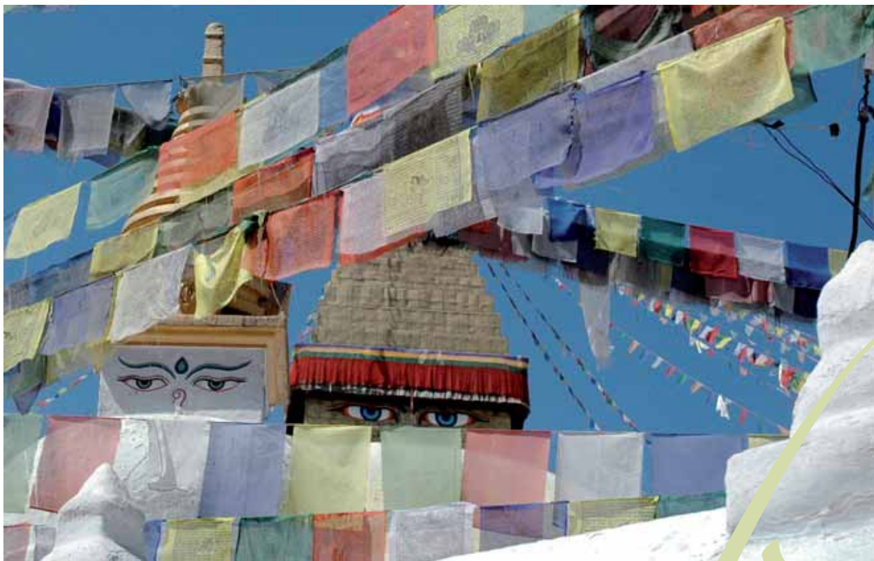
Kathmandú: Buddhist Stupa