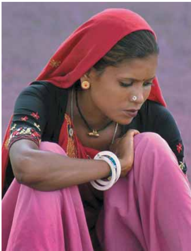
Mujer en Delhi