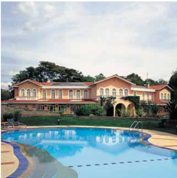
Nairobi: House of Waine

Billete de avión KLM en clase turista «T» Traslados en servicio privado en Nairobi Transporte en avioneta regular de Nairobi a Samburu, de Naivasha a Masai Mara y de Maasai Mara a Nairobi Avioneta privada de de Samburu a Naivasha Media pensión en Nairobi Pensión completa durante los días de safari Safaris en los parques en vehículos 4x4 Entradas y permisos a los parques Tasas de billete (238 €).