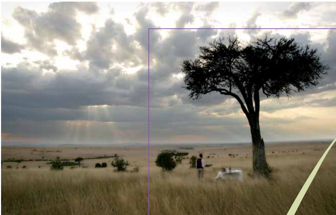
Maasai Mara: Sala's Camp