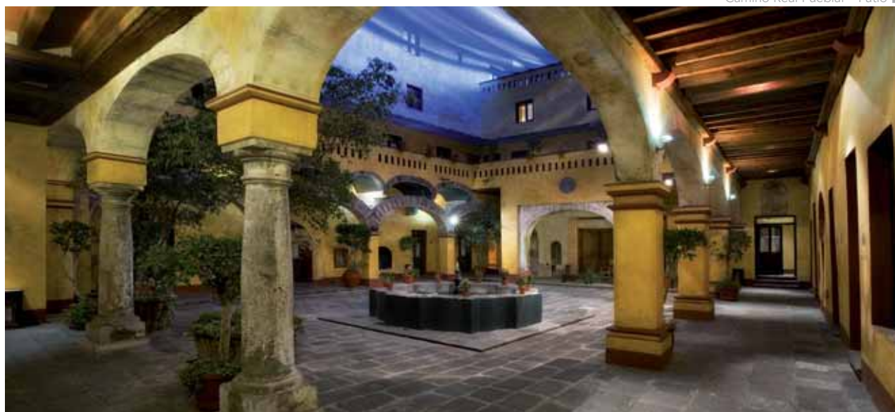
Camino Real Puebla • Patio

Billete de avión de AeroMexico en clase turista «N» Estancia en los hoteles mencionados, en régimen de alojamiento y desayuno Traslados y visitas en servicio privado Tasas de billete (65 €).