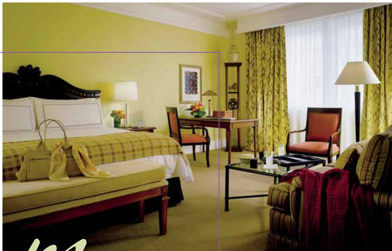
Four Seasons Hotel México, D.F. • Deluxe Room