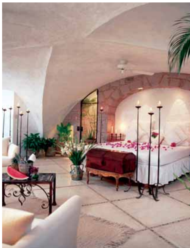
Hacienda San Gabriel • Habitación Luna