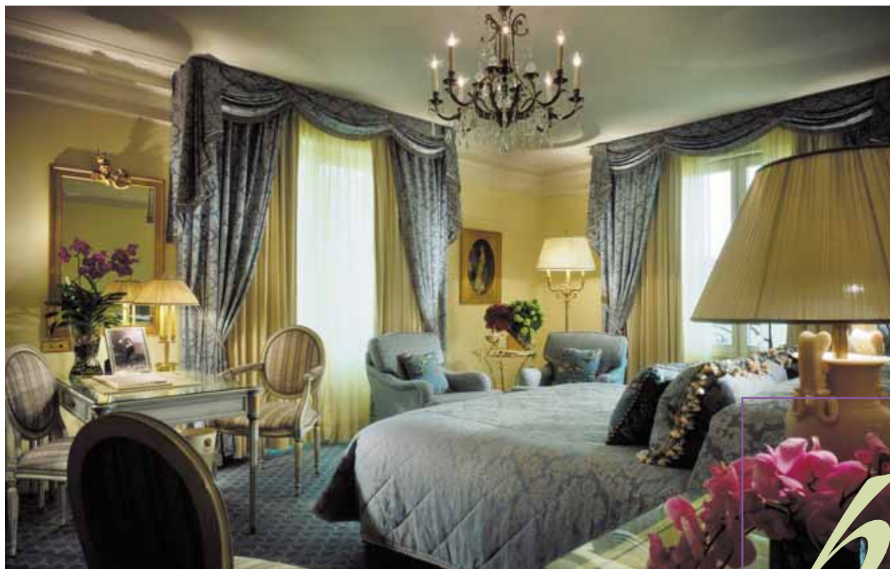
Four Seasons Hotel George V Paris • Deluxe Room