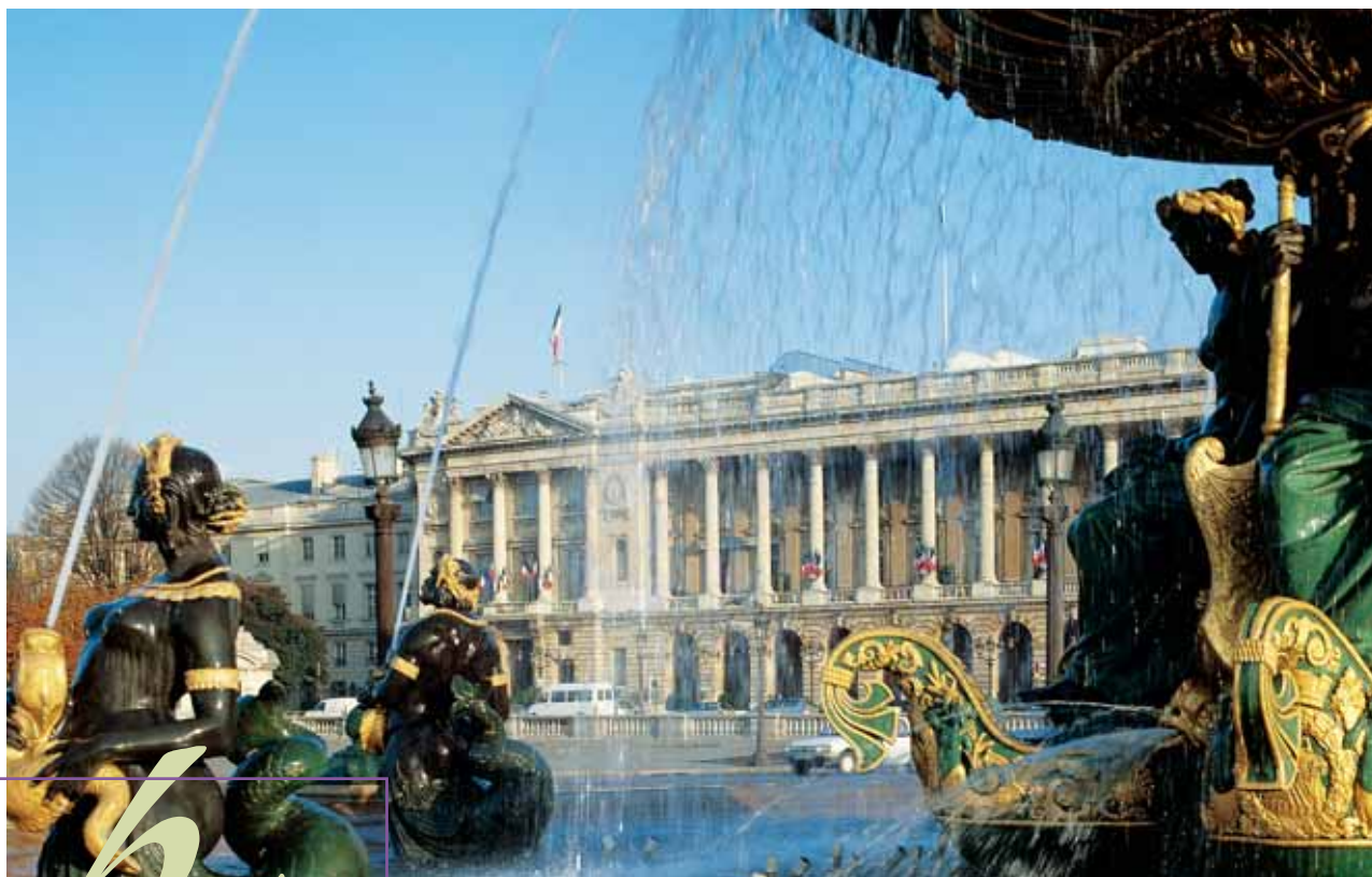
Hôtel De Crillon