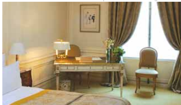
Hospes Lancaster • Prestige Room