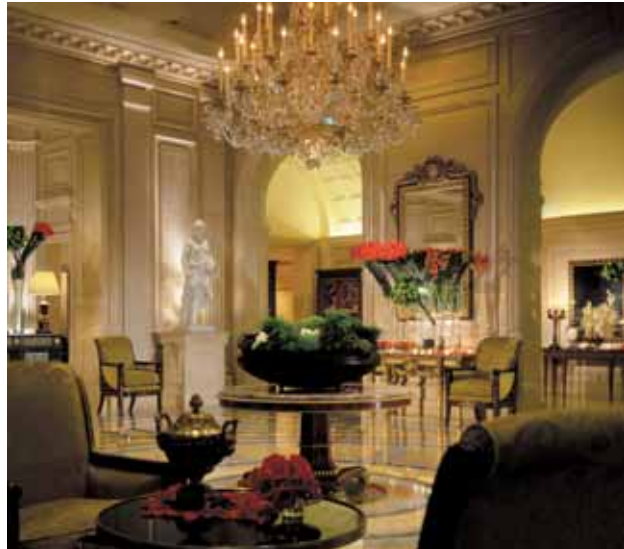
Four Seasons Hotel George V Paris • Lobby