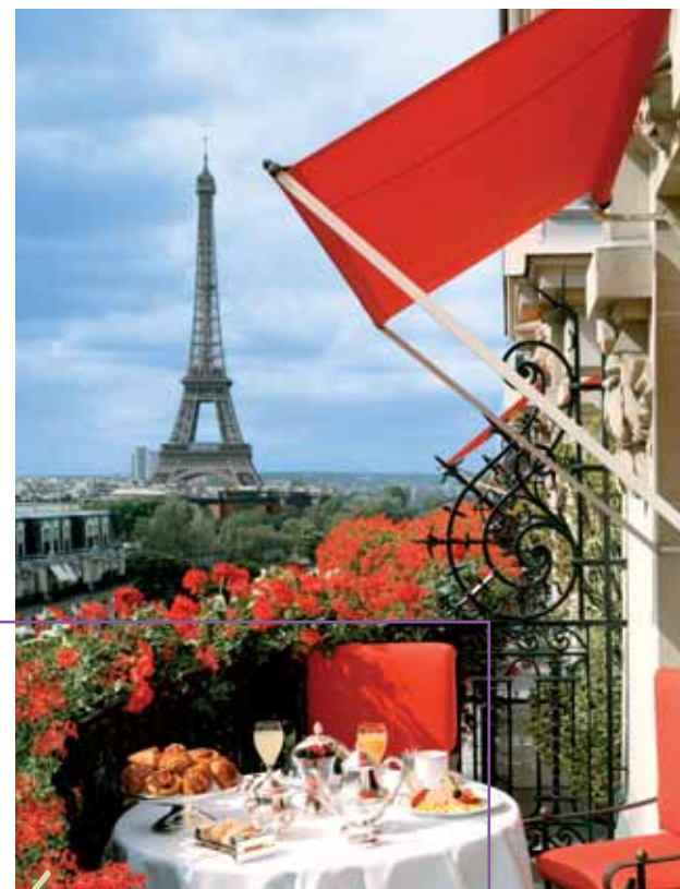
Hôtel Plaza Athénée Paris • Room with a View