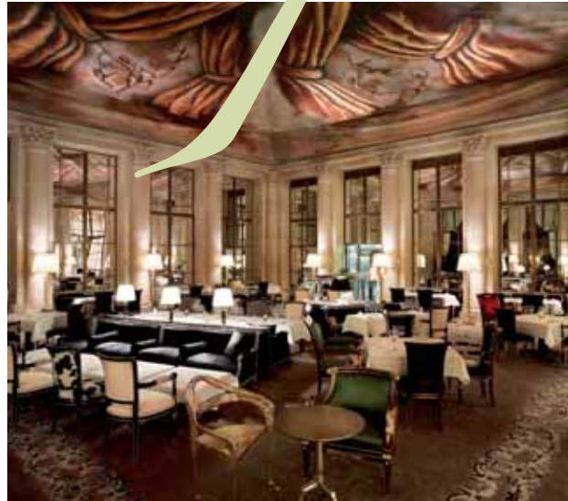
Le Meurice • Le Dali Restaurant