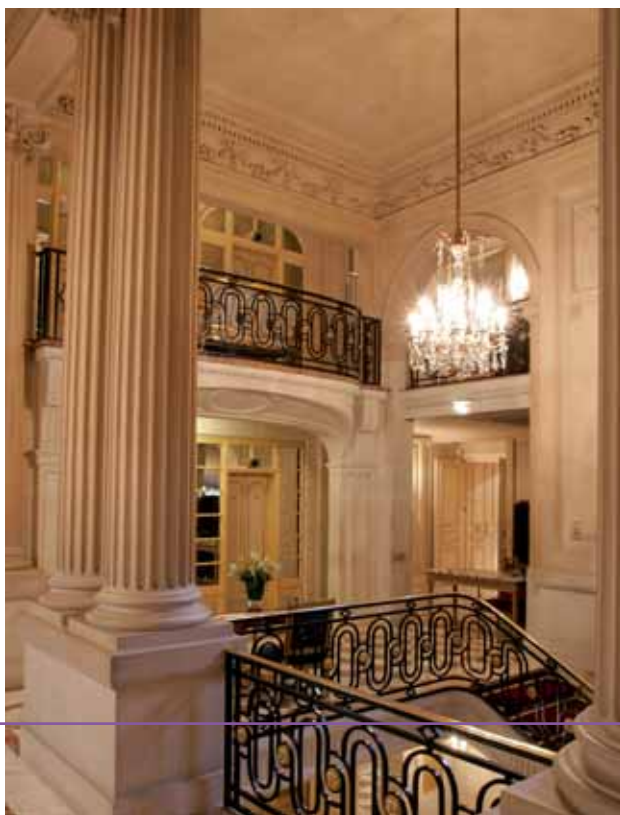
Hôtel de Crillon • Escalier d'Honneur