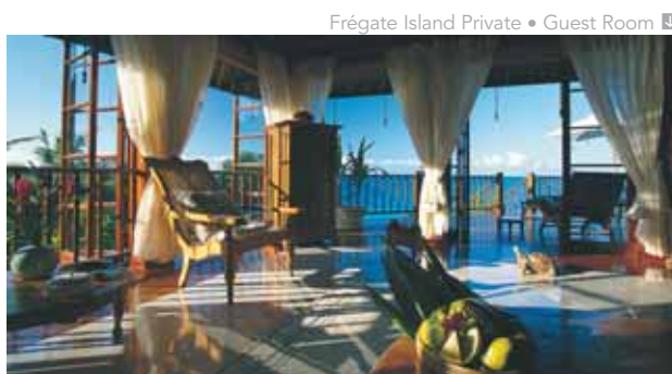
Frégate Island Private • Guest Room