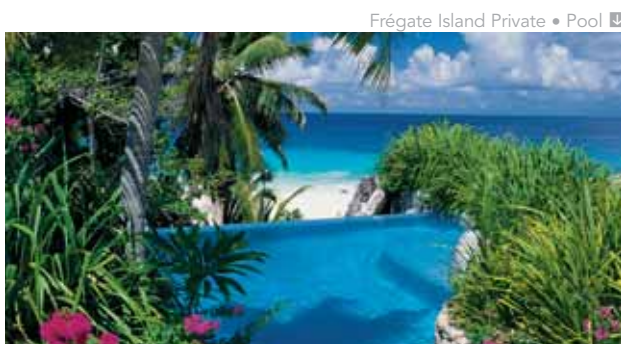
Frégate Island Private • Pool